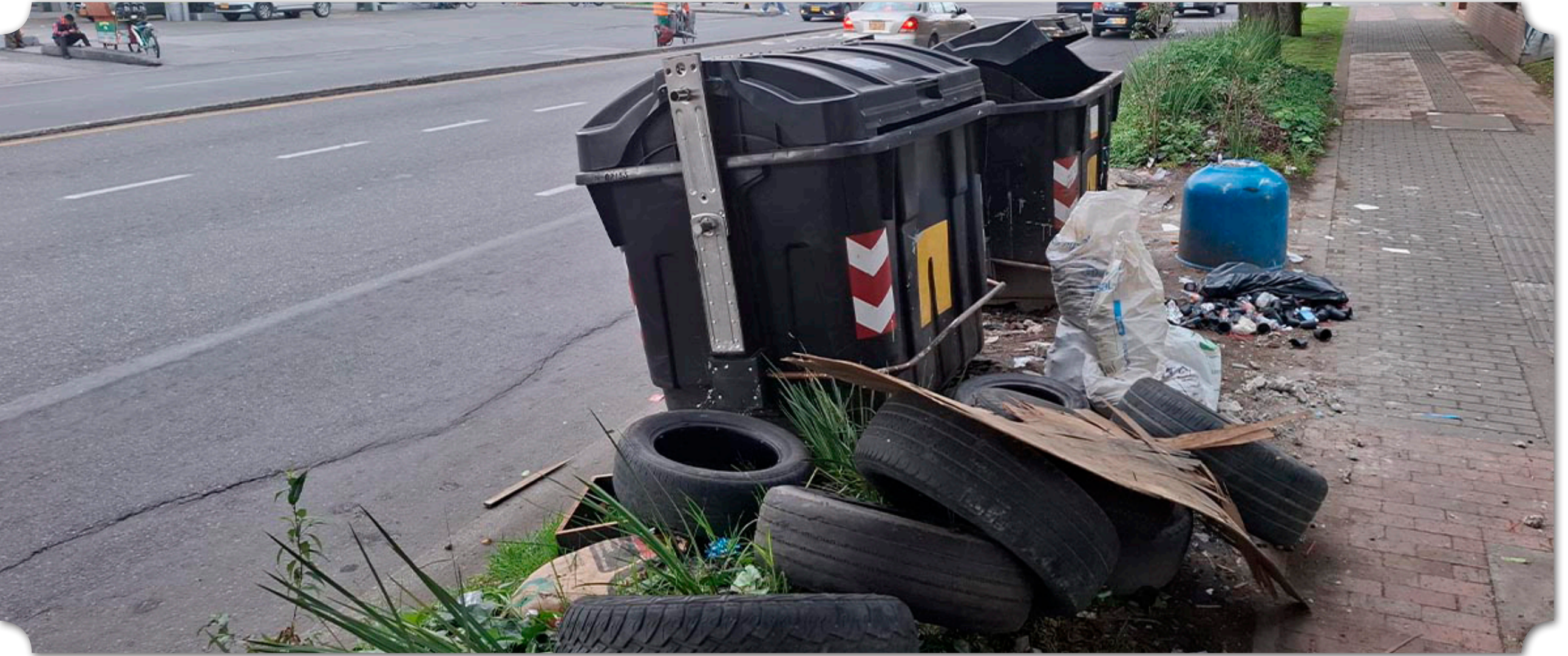
Contenedores de basuras en la ciudad