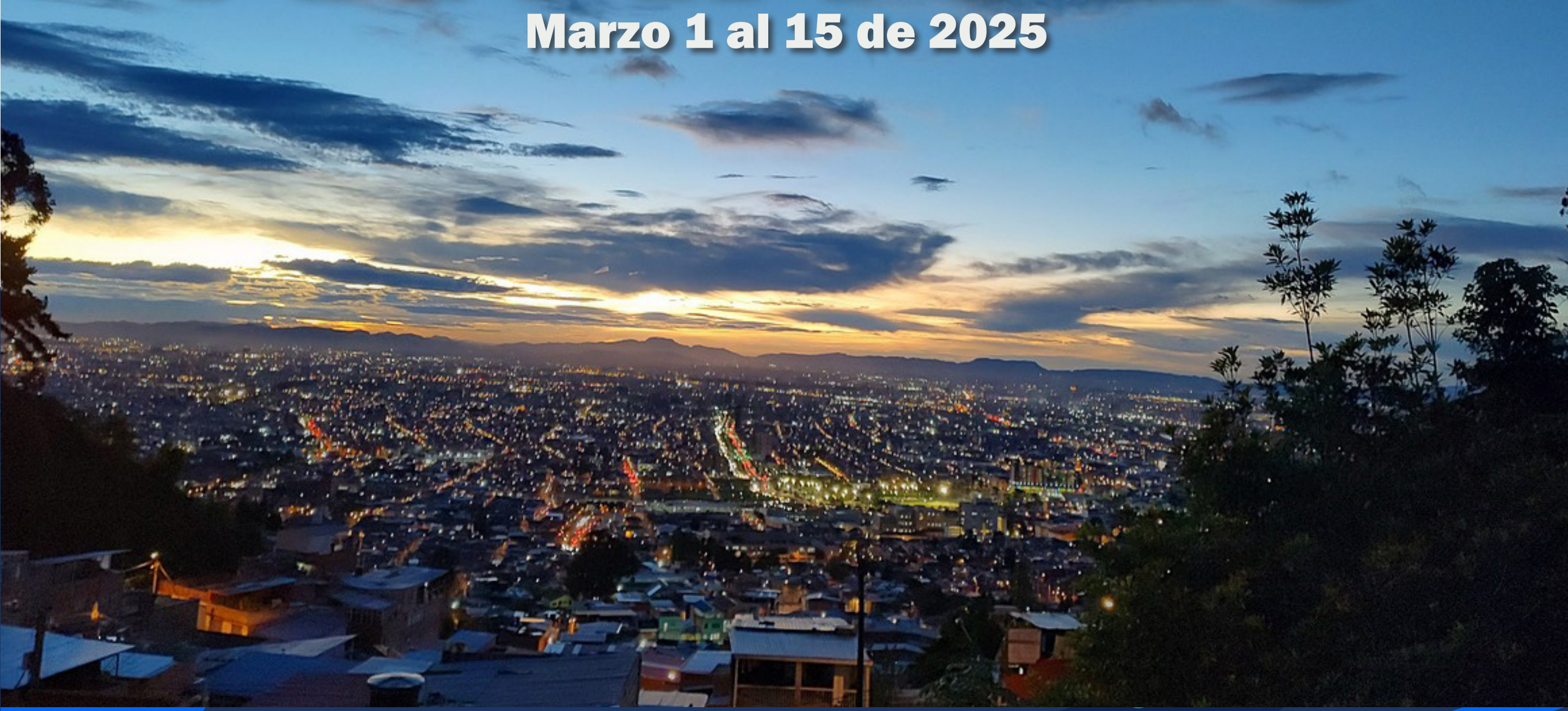
Foto: Panorámica de Bogotá